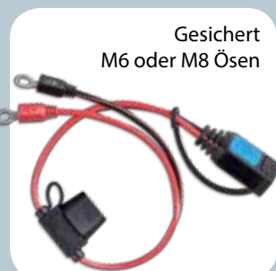
Gesichert M6 oder M8 Ösen