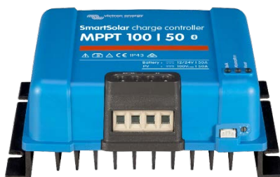
SmartSolar Lade-Regler MPPT 100/50