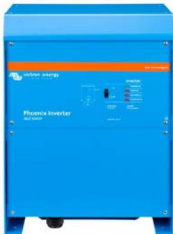
Phoenix Inverter 24/3000