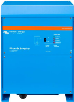
Phoenix Inverter 24/5000