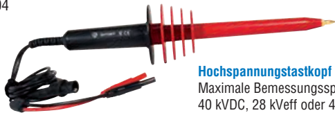
Hochspannungstastkopf SHT40KV Maximale Bemessungsspannung: 40 kVDC, 28 kVeff oder 40 kV Spitze Teilungsverhältnis Eingang/Ausgang: 1 kV/1 V