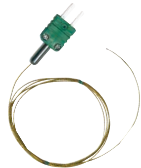
SK-Thermoelementfühler Für Temperaturmessungen von -50 °C bis +120 °C