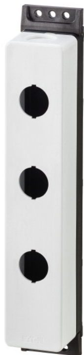
Aufbaugehäuse, flach, 3 Einbaustellen, M22