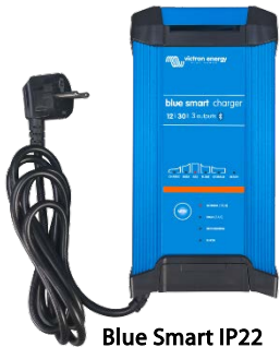
Blue Smart IP22 12/30 (3)