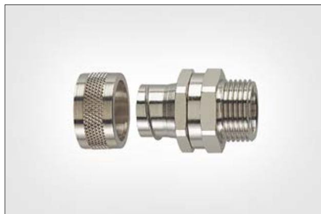
HeloGuard PCS-SM mit drehendem Außengewinde.