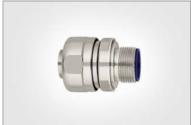
HelaGuard PSRSC-FMCFSS Edelstahlverschraubungen für Anwendungen in der Lebensmittelindustrie.