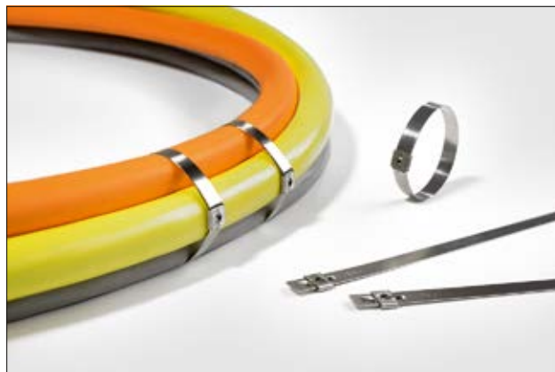
Edelstahlkabelbinder der MST-Serie für besonders raue Umgebungen.