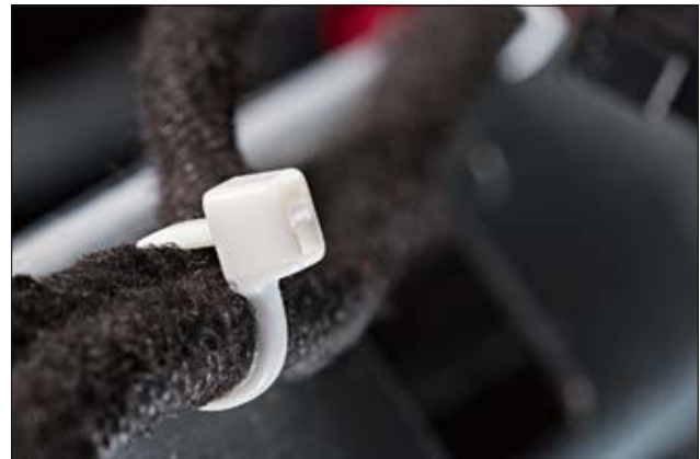
Weiße Kabelbinder der T-Serie für erhöhte Brandschutzanforderungen (PA66V0).