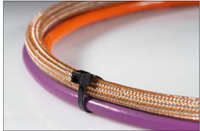
LK-Serie als Ergänzung zur HellermannTyton T-Serie.