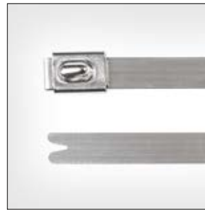
Edelstahlkabelbinder, unbeschichtet, MBT_SS, MBT_HS.