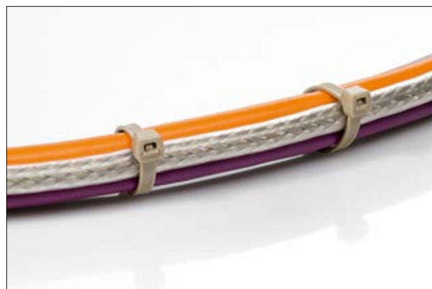
Das Design der außenverzahnten PEEK Kabelbinder ermöglicht ein besonders leichtes Einschlaufen.