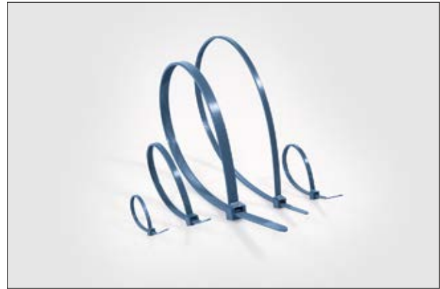
MCTPP Kabelbinder haben eine sehr gute chemische Beständigkeit und sind auch für einen höheren Temperaturbereich geeignet.