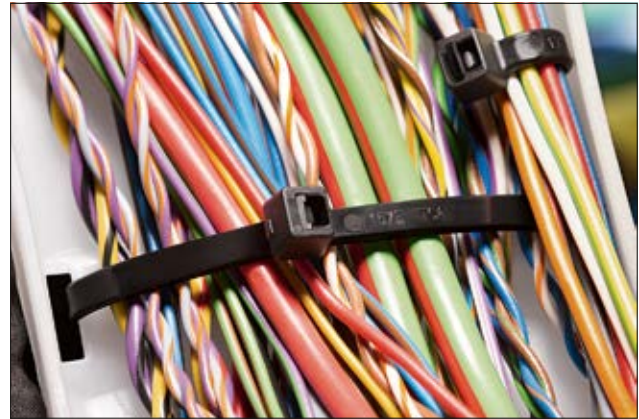
Kabelbinder der T-Serie sind universell einsetzbar (PA66).