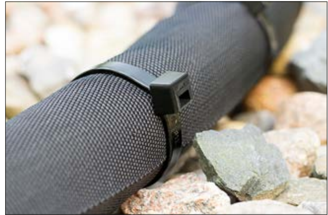
Schlagzähmodifizierter Kabelbinder der T-Serie (PA66HIRHS).