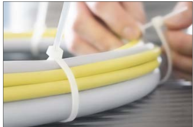
RELK Kabelbinder zur temporären Bündelung.