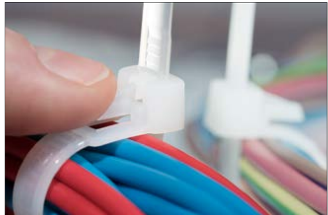
Die Kabelbinder der REL-Serie sind mit einem einfachen Fingerdruck zu öffnen.