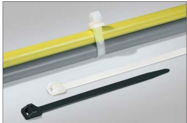
Für große und schwere Bündelungen lassen sich die RT250-Kabelbinder verwenden.