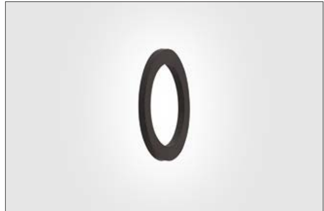
HelaGuard AWS Chloropren-Dichtungsscheibe.