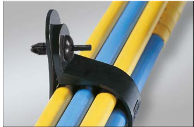
Spreizniete TY8P1 in der Anwendung.