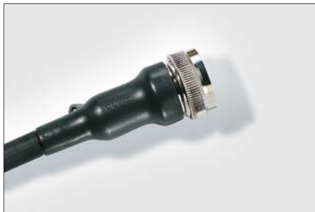
Helashrink Serie 150.