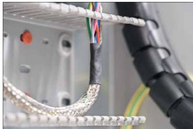
TF21 - erfüllt eine Vielzahl an Industrienormen.