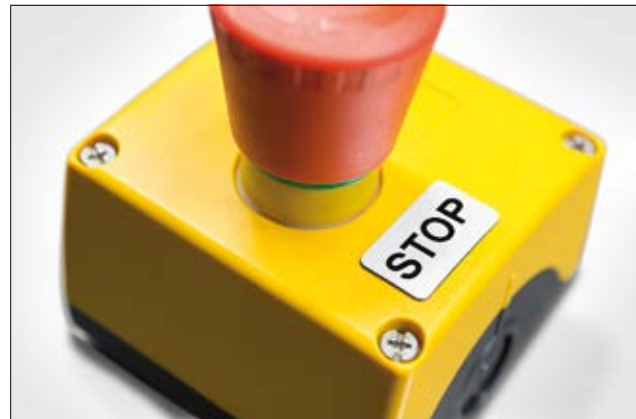
Idealer Ersatz für gravierte Schilder: Panel-Etiketten.

Zur problemlosen Gestaltung der Etiketten empfehlen wir die Etikettensoftware TagPrint Pro.