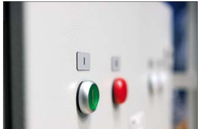
Idealer Ersatz für gravierte Schilder: Panel-Etiketten.