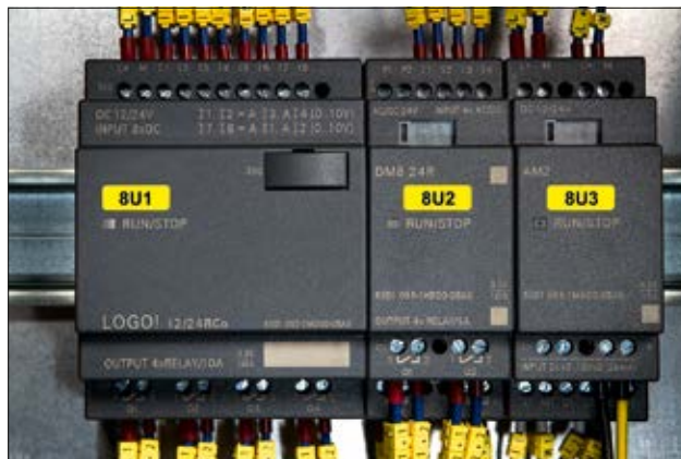
Helatag für die Kennzeichnung im Schaltschrank.

Zum problemlosen Bedrucken der Etiketten empfehlen wir unsere Drucksysteme, Farbbänder und Etikettensoftware.