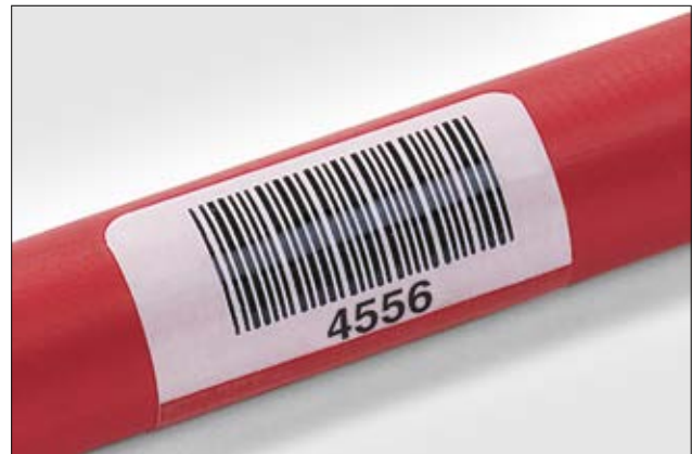
Helatag sorgt für die dauerhafte Kennzeichnung von Kabeln mit Barcodes.