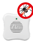
Spinnen Art.-Nr. 66987