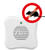
Mäuse Art.-Nr. 66986