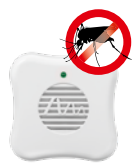
Stechmücken Art.-Nr. 66985