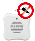
Silberfischchen Art.-Nr. 66990