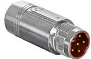
Polbild Ansicht steckseitig