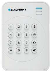
1x Funk-Bedienteil (inkludiert)