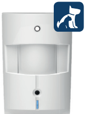
1x Haustierimmuner PIR-Sensor mit Kamera (inkludiert)