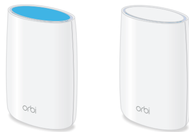
Orbi Router (Modell RBR50)