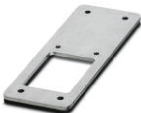
Adapterplatte, Bauform: B24 auf B6

Bitte beachten Sie, dass die hier angegebenen Daten dem Online-Katalog entnommen sind. Die vollständigen Informationen und Daten entnehmen Sie bitte der Anwenderdokumentation. Es gelten die Allgemeinen Nutzungsbedingungen für Internet-Downloads. ( http://phoenixcontact.de/download )