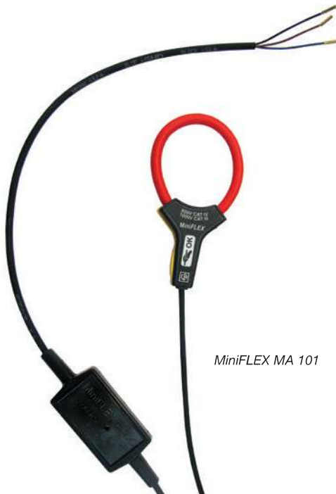
MiniFLEX MA 101