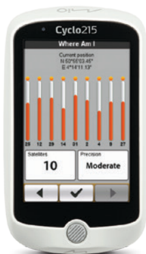
Wo bin ich? - Funktion