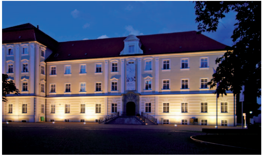
Energieeffizient, sicher und stimmungsvoll: Beleuchtung in Bad Schussenried.

Das Astroprogramm sorgt jetzt dafür, dass die Leuchten täglich mit dem Sonnenuntergang einschalten und bei Sonnenaufgang ausschalten. Da die Schaltuhren zwei Kanäle haben, wird jetzt in der Nachtzeit zwischen 0.30 Uhr und 4.30 Uhr ein Teil der Leuchte abgeschaltet, während der andere Teil durchgehend für eine Grundbeleuchtung sorgt. So wird Energie gespart und das Sicherheitsgebot trotzdem erfüllt. Für die unterschiedlichen Bedingungen vor Ort, wie zum Beispiel eine repräsentative Beleuchtung im Zentrum, die Wegebeleuchtung in einem Wohnviertel oder eine abseits liegende Häusergruppe, können unterschiedliche Wochenprogramme und Jahresprogramme mit Prioritätsstufen, Feiertagen, Schulferien usw. angelegt werden.