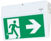
EURO X LED