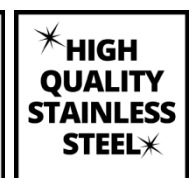
HIGH QUALITY STAINLESS STEEL