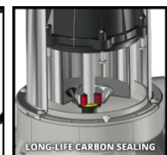
LONG-LIFE CARBON SEALING