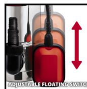
ADJUSTABLE FLOATING SWITCH