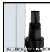
UNIVERSAL HOSE CONNECTOR