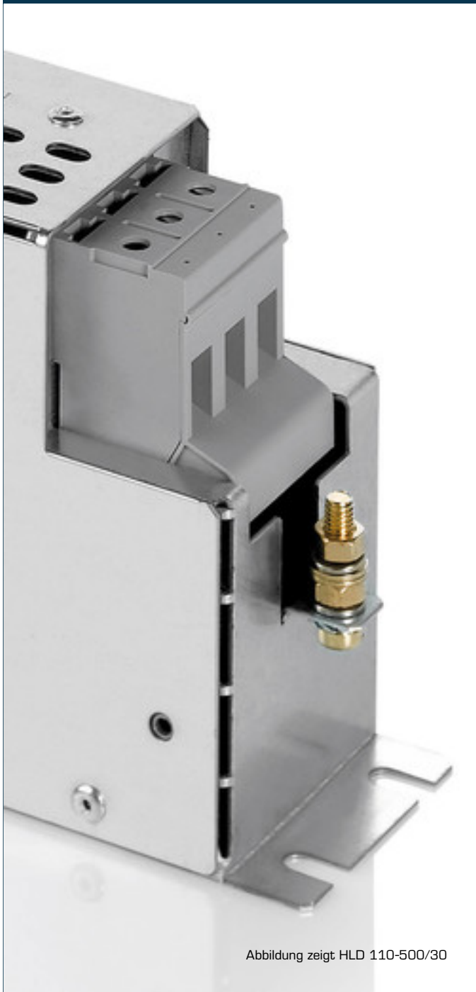
Abbildung zeigt HLD 110-500/30