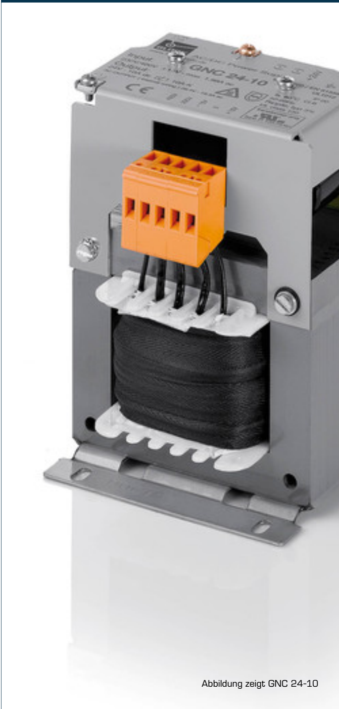
Abbildung zeigt GNC 24-10