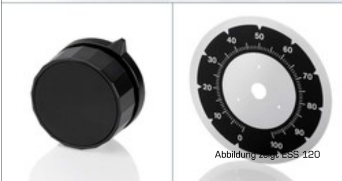
Abbildung zeigt ESS 120