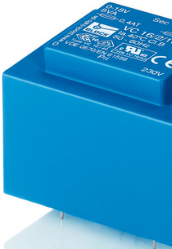
Abbildung zeigt VC 16/2/18