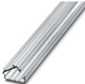
Abdeckprofil, Länge: 300 mm, Farbe: transparent

Bitte beachten Sie, dass die hier angegebenen Daten dem Online-Katalog entnommen sind. Die vollständigen Informationen und Daten entnehmen Sie bitte der Anwenderdokumentation. Es gelten die Allgemeinen Nutzungsbedingungen für Internet-Downloads. ( http://phoenixcontact.de/download )