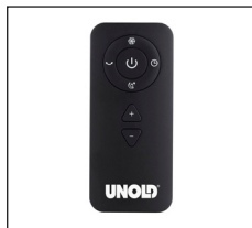
Mit praktischer Fernbedienung