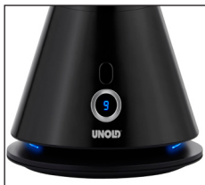
Blaue Ambiente- beleuchtung