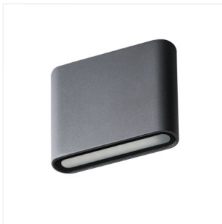
GARTO LED EL 8W-GR