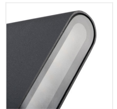
GARTO LED EL 8W-GR