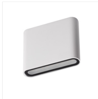
GARTO LED EL 8W-W