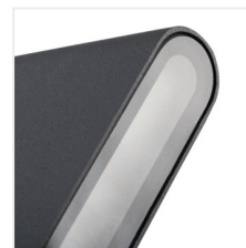
GARTO LED EL 8W-GR