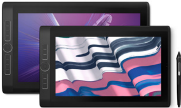
Vorgestellte Produkte: Wacom MobileStudio Pro 15,6 Zoll und 13,3 Zoll Künstler: Future Deluxe & Santtu Mustonen

Was du willst, wo du willst ... mit dem Wacom MobileStudio Pro kannst du ganz nach deinen Wünschen kreativ werden. Mit seinem beeindruckenden Display, einem präzisen, leistungsstarken Stift und mehr Rechenleistung ermöglicht es dir wahre Unabhängigkeit. Darüber hinaus sorgen ein komplettes Studio mit kreativen Tools, eine herausragende Grafikkarte und die lange Akkulaufzeit dafür, dass nichts deinen kreativen Flow beeinträchtigen kann.