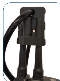
Schutzkappe mit Aufnahmefach für Metallhülsen