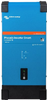
Phoenix Wechselrichter Smart 12/2000