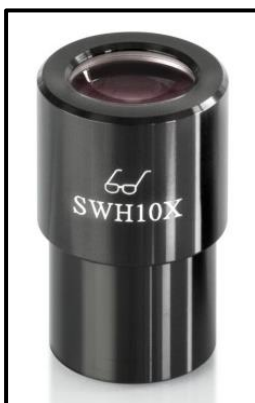
High Eye Point Okular (erkenntlich am Brillen-Symbol)