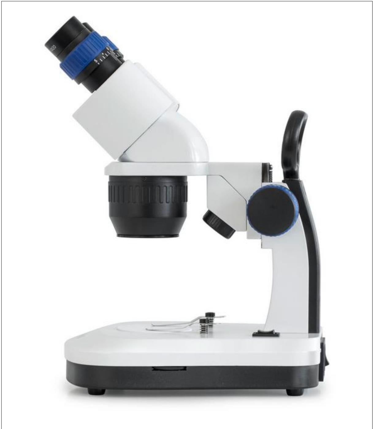
Fertig zusammengebautes Stereomikroskop